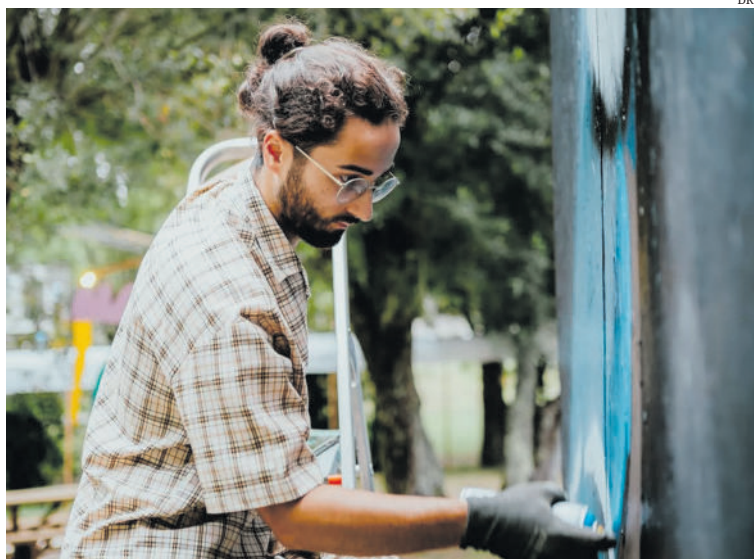
Artista de Pombal começou a fazer graffiti aos 14 anos

Nos tempos livres, pinta telas inspiradas nas suas viagens. As últimas exposições foram em 2024: “Retratos da Cidade Vermelha”, na Biblioteca Municipal de Leiria, e “Voar Além”, no Centrum Sete Sóis Sete Luas da Ilha do Maio, em Cabo Verde. No ano anterior, as suas obras estiveram expostas na Casa Varela, em Pombal, numa mostra a que chamou “Identidade”.