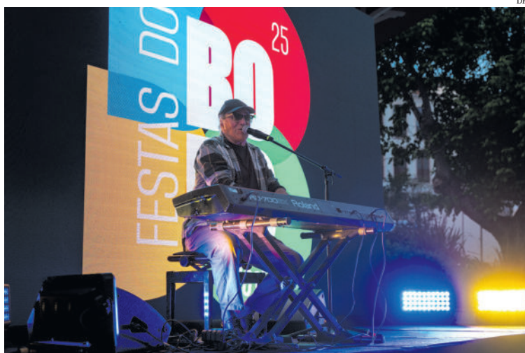
José Cid actua no último dia do evento

O anúncio foi feito por Pedro Pimpão, presidente da autarquia, durante a apresentação do cartaz das Festas do Bodo, em Maio, ocasião em que esteve presente o cantor José Cid, que actuará no dia de encerramento do evento, e ainda