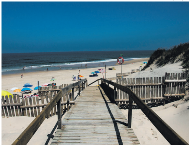
A Praia do Osso da Baleia é a única reconhecida oficialmente