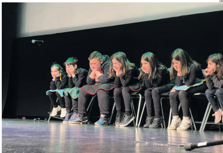
Numa semana, as crianças conseguem criar uma peça de dez, 15 ou 20 minutos

não queiram participar, pedimos-lhes para estarem connosco. Alguns sugerem fazer os adereços e a cenografia nas aulas, e outros perguntam se queremos que vão ensaindo com os alunos. Empenham-se, divertem-se, e integram o próprio processo”, assegura. Este ano, inscreveram-se 20 turmas, com as quais trabalharam ao longo de cinco semanas.