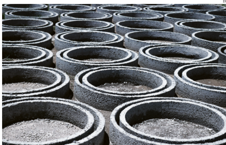
A indústria transformadora é a actividade predominante das empresas gazela

O conceito de Gazela corresponde a empresas com idade igual ou inferior a cinco anos, e com ritmos de crescimento elevados, sustentados ao longo do tempo. “São organizações inovadoras, capazes de se posicionarem de forma diferenciadora nos mercados, nos quais afirmam a sua competitividade e constroem