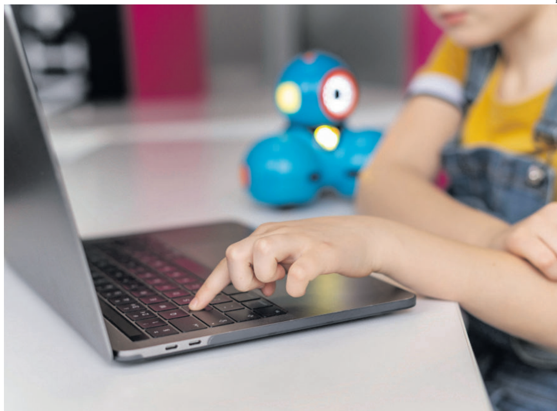
Num primeiro contacto, muitos alunos revelaram não saber escrever no teclado

Para colmatar essas dificuldades, no 3.º ano, as crianças têm uma iniciação ao nível da literacia digital e programação por blocos, e só no 4.º ano passam para um nível mais avançado, em função das suas capacidades. Numa fase inicial, os alunos trabalham individualmente, a partir de tutoriais,