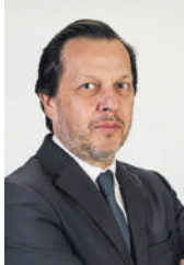
Opinião Horácio Mota

S e há um consenso transversal entre empresários, é este: Portugal é um País excessivamente burocrático. O problema não é novo, mas a sua persistência tornou-se insustentável num mundo que se move a outra velocidade. Numa economia em que o tempo vale dinheiro, e muitas vezes empregos, os entraves administrativos continuam a asfixiar a competitividade, a inovação e a coragem de empreender. A complexidade regulatória em Portugal é desproporcional à sua dimensão. Abrir uma empresa pode ser rápido no papel, mas na prática esbarra em autorizações lentas, portais confusos, cruzamentos intermináveis de dados e interpretações contraditórias entre serviços públicos. O mesmo se aplica à contratação de trabalhadores, aos licenciamentos industriais, aos projetos urbanísticos ou à submissão de candidaturas a fundos europeus. O que deveria ser um processo ágil e transparente transforma-se frequentemente num teste de resistência. O resultado é perverso: empresas que podiam crescer mais depressa desistem a meio; investimentos que