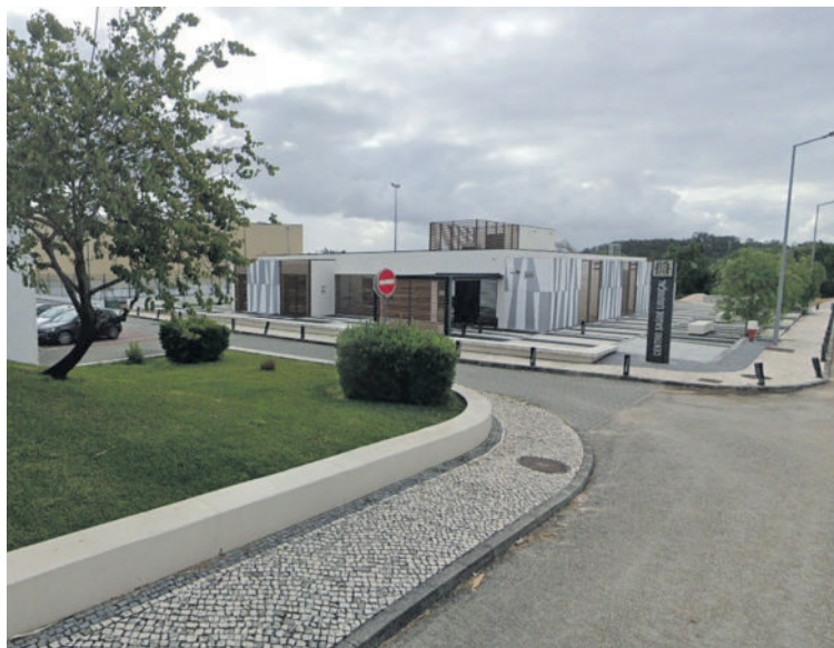
Com três médicos, as consultas passaram a ser diárias, e até às 20 horas

O autarca diz que o Pólo de Saúde ficou, agora, com três médicos e três enfermeiros. “Tendo em conta a nossa centralidade, ainda pode haver necessidade de colocar mais