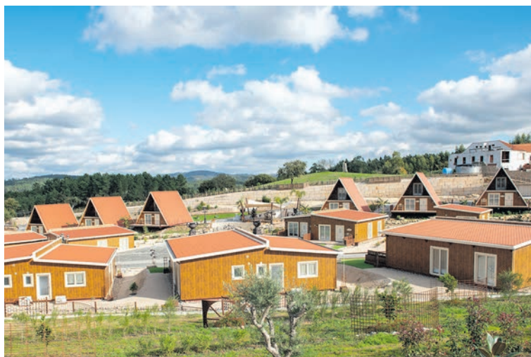
Aldeia MilicAires vai ter festa de passagem do ano