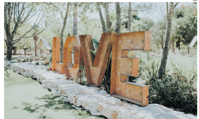
Casamentos têm “peso muito importante” nos negócios das quintas

244 800 400 (chamada para rede fixa nacional)