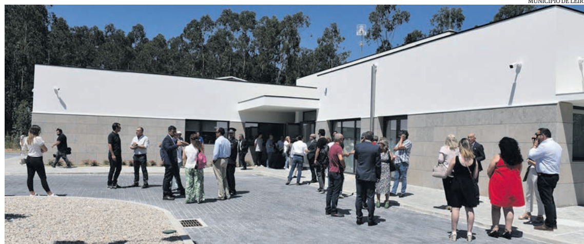
Unidade de saúde foi inaugurada em Julho deste ano