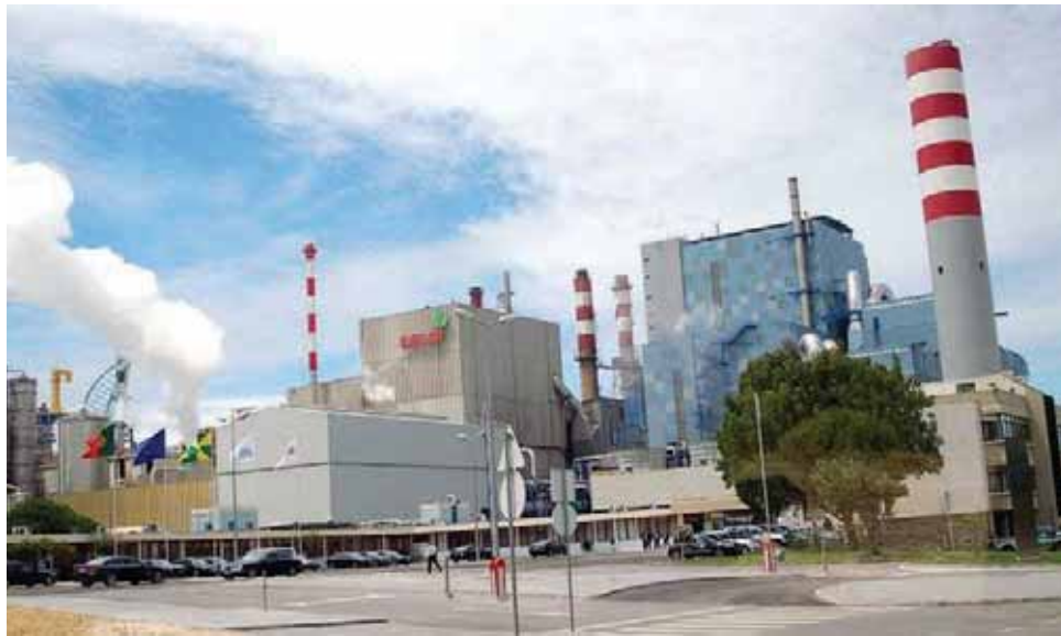
A nova tecnologia permite recuperar desperdícios finos resultantes do processo de conversão da madeira

A Altri definiu quatro vectores estratégicos de desenvolvimento futuro em que se centrará a sua actividade,