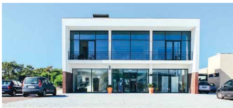
A Incubadora sob gestão da ACIFF tem como associados a Câmara Municipal, o Porto da Figueira da Foz e a Universidade de Coimbra

Tendo já acompanhado mais de 60 empresas nestes 16 anos de actividade, entre as quais a United Resins, a Constrind, a Scales Oceans, empresas sólidas no concelho que posteriormente se instalaram no Parque Industrial, a Incubadora do Mar&Indústria apresentava, em final de 2021, uma taxa de ocupação na ordem dos 87% com um total de 12 entidades em incubação física, que ocupavam cerca de 21 dos 24 módulos existentes, oito empresas em regime de incubação virtual e uma incubação em regime cowork.