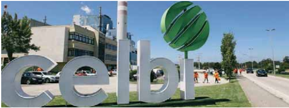
A Celbi, do grupo Altri, ascendeu à categoria de maior empresa, com 509,3 milhões de euros de volume de negócios