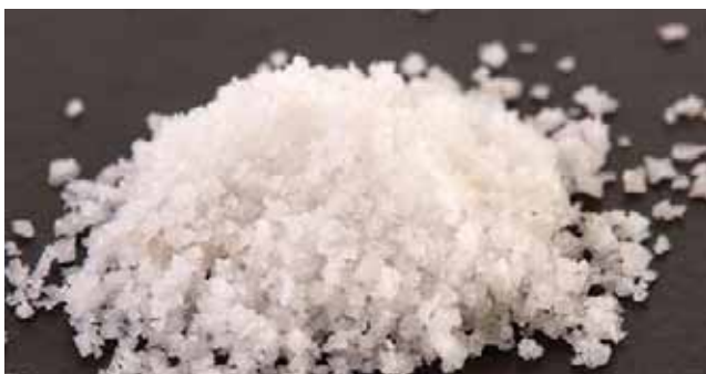
O primeiro produto foi um esfoliante para pés

Diariamente a Celbi leva o nome de Portugal aos mercados mais evoluídos. Criando riqueza, promovendo emprego, protegendo o ambiente e valorizando os recursos naturais e humanos, a Celbi mantém-se fiel ao seu objectivo: ser o melhor produtor europeu de fibras celulósicas e estar entre os mais competitivos, à escala global!