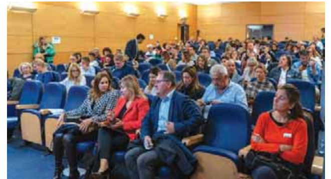
No seminário foram apresentados projectos da UC, concretizados no laboratório Marefoz