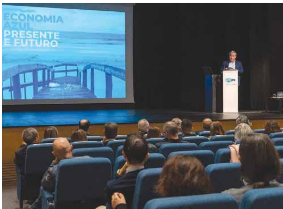
A criação de um pólo tecnológico e empresarial ligado ao mar é defendido pelo presidente da CIM Região de Coimbra