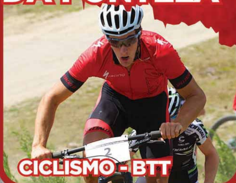
CICLISMO - BTT