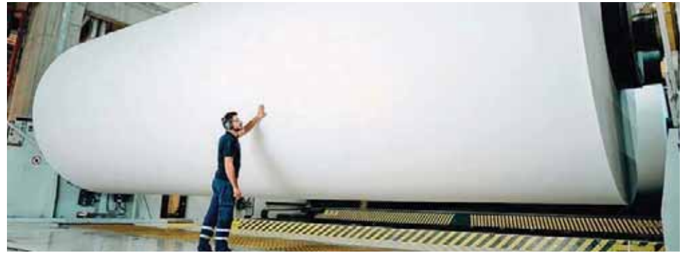
A Navigator Papel Figueira teve 472,5 milhões de euros de facturação e desceu para o segundo lugar

A recuperação da actividade empresarial no concelho da Figueira da Foz no ano passado foi notória e as 250 maiores empresas alcançaram, em 2021, um volume de negócios total que ascende a 3 mil milhões de euros (3.012.198.298 euros mais concretamente).