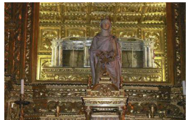
A exposição da mão da Rainha Santa, junto do corpo colocado num túmulo de prata e cristal, é um evento raro e especial, que atrai milhares de pessoas a Coimbra