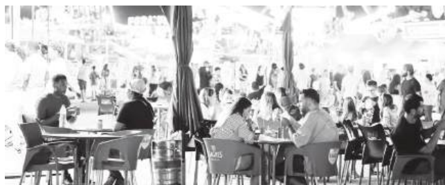
A Feira Popular de Coimbra assume-se com uma festa para todos, de portas abertas com entrada gratuita

Não há festas da cidade sem a Feira Popular de Coimbra, iniciativa que a União de Freguesias de Santa Clara e Castelo Viegas faz muito bem, ultrapassando todas as dificuldades que teimam em colocar no caminho da organização. Com mais de 300 mil visitantes esperados, a Feira Popular de Coimbra assume-se com uma festa