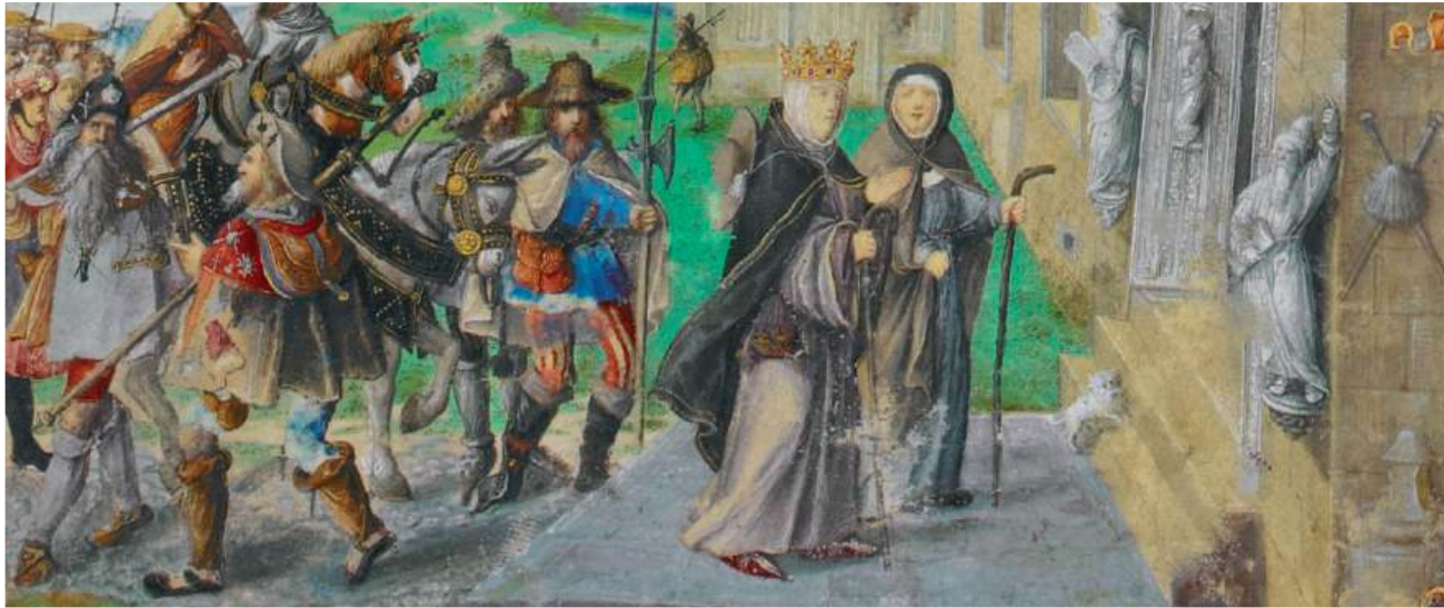
A chegada da Rainha Santa Isabel à Catedral de Santiago de Compostela

O conto “A Rainha Santa e o Mistério de São Cristóvão do Rio Mau” é apresentado publicamente na Igreja de Santa Isabel, em Lisboa, nesta véspera do dia consagrado à Rainha Santa.