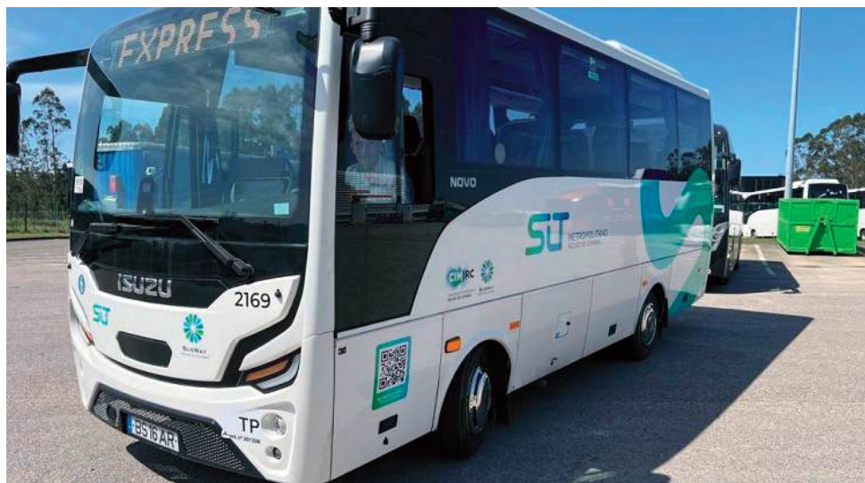
O novo sistema de transportes entra em funcionamento em 1 de Agosto com mais de 200 linhas

“O arranque do SIT Metropolitano representa um salto qualitativo gigante na mobilidade da nossa região e é o culminar de um