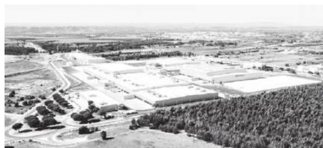
A partir do Bloco Logístico de Almeirim são abastecidas as 63 lojas que a Mercadona dispõe actualmente em Portugal

Este bloco logístico permitiu criar 630 novos postos de trabalho estáveis e de qualidade. O processo de formação das novas incorporações representou um investimento de 7,2 milhões de euros, reforçando a aposta da empresa nas pessoas que compõem a sua equipa, um dos ativos fundamentais e, sem dúvida, a causa do sucesso do seu projecto empresarial. Além disso, permitiu promover 50 colaboradores para cargos de maior responsabilidade, confirmando que o Projecto Mercadona é comprometido