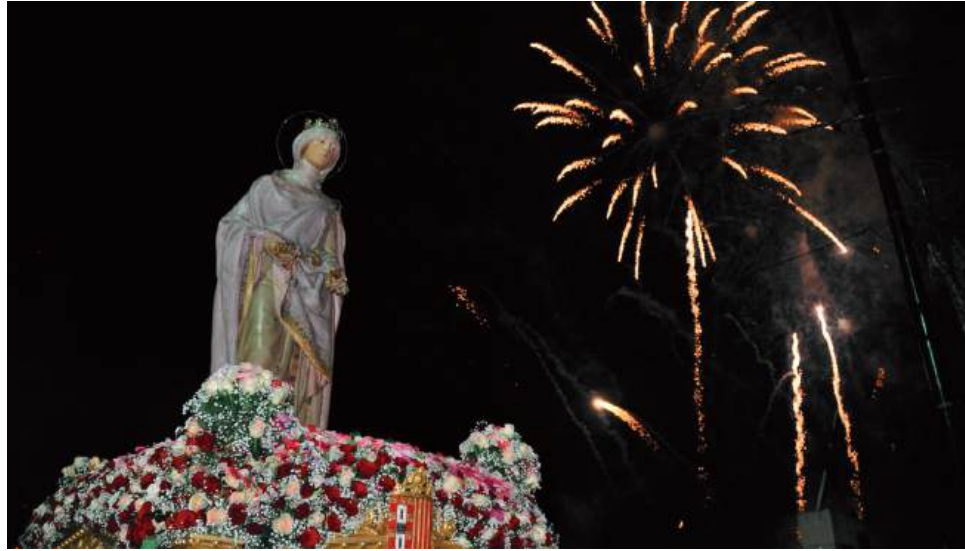
No dia 10 de Julho, pelas 22h30, a imagem da Rainha Santa Isabel será recebida no Largo da Portagem com fogo-de-artifício

O mês de Julho iniciou-se com o Tríduo em honra da Rainha Santa Isabel, que se realiza entre os dias 1 e