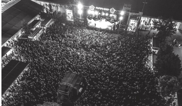
► FAFIPA voltou a atrair milhares a Alvaiázere, ajudando a dinamizar a economia local

Segundo a professora universitária, os referidos quatro eventos “representam um verdadeiro investimento estratégico no desenvolvimento local, com impacto económico e social, promovem o ter-