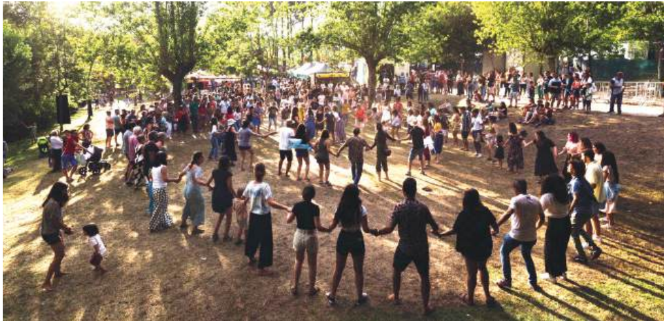
► O Ti Milha está de volta entre os dias 18 e 20 de Julho, e este ano chega com reforços de peso

A festa começa logo na véspera, a 17 de Julho, com a já clássica Recepção ao Campista, um momento feito para quebrar o gelo entre locais e festivaleiros, de copo na mão e sorriso na cara. Vai acontecer no Alpha Bar, com DOVECOTE em concerto e DJ Robbie a fechar a noite. E o melhor? Entrada gratuita. É chegar, montar a tenda e