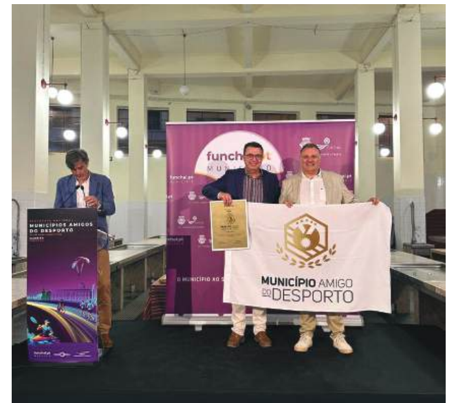
► A cerimónia de entrega do Galardão decorreu no âmbito do congresso anual promovido pela plataforma Cidade Social

Esta distinção reafirma Soure como uma referência no incentivo à prática de actividade física de forma regular por parte dos cidadãos, desde a infância à idade sénior, contribuindo para o seu bem-estar e qualidade de vida.