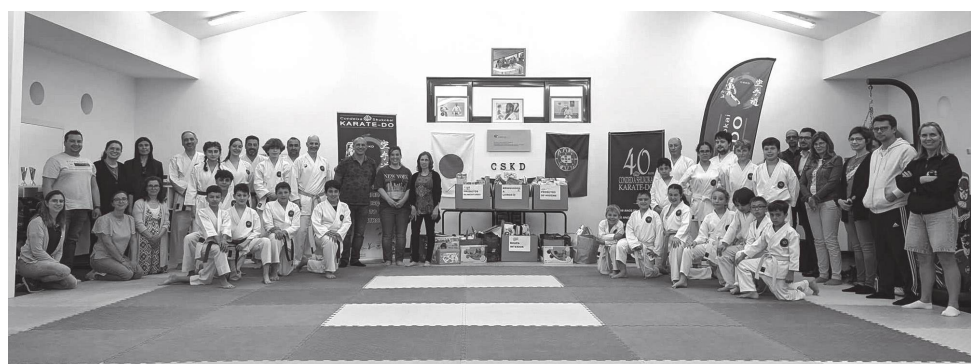
► Karatecas entregaram bens à Loja Social do Município de Condeixa

A iniciativa enquadrou-se no âmbito do Projecto Social e Solidário do CSKD, e tem como objectivo “dinamizar o karaté/artes marciais como veículo de Acção Social e Solidária, na formação dos seus praticantes, no exercício da cidadania e da ajuda ao próximo”.