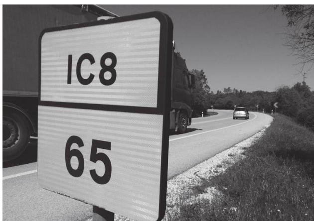
► Importância estratégica do IC8 não tem sido até agora acompanhada de vontade política do poder central

O IC8 é uma via com elevada sinistralidade rodoviária e com alto tráfego de veículos pesados, o que dificulta a circulação e pro-