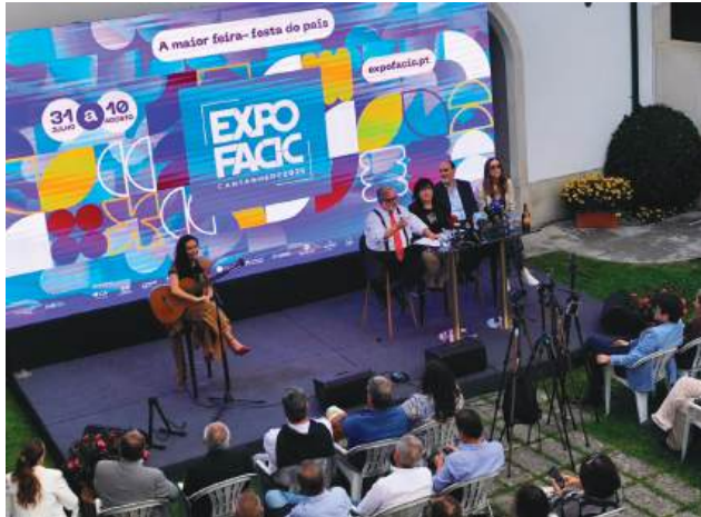
► Organização apresentou programa oficial do certame